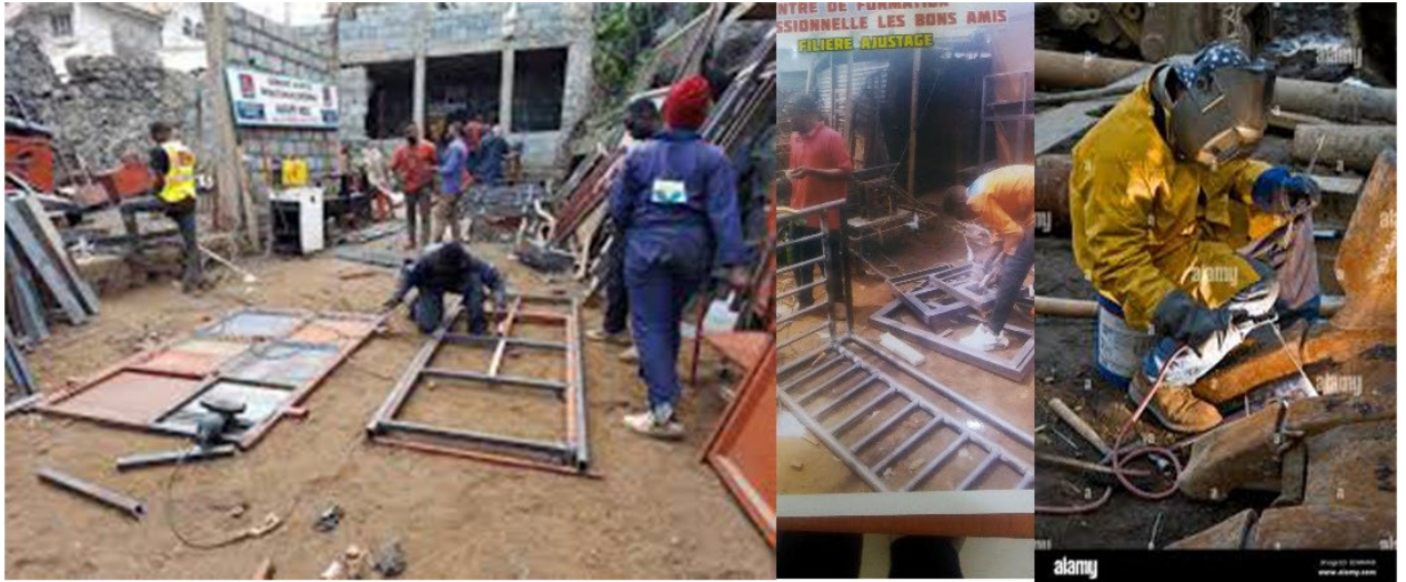
Photo 1 : Atelier pratique d'ajustage et soudure – Commune de Limete